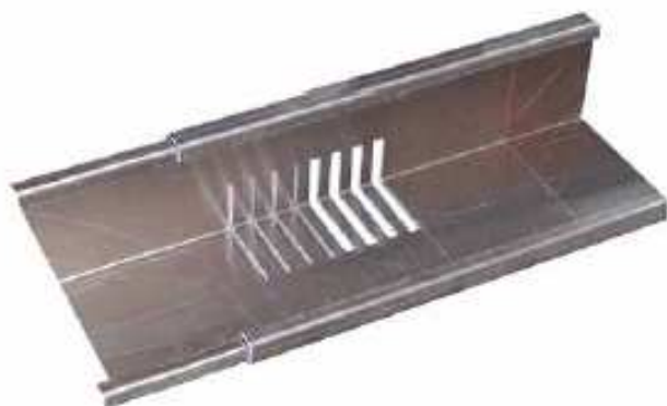
Jonction bordure GreenRoof