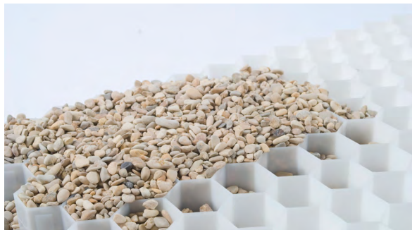
ECCOgravel stabilisateur de gravier