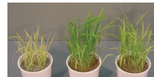
Témoin Sequestrene Réf