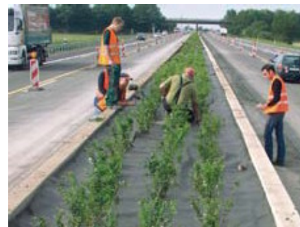
Avant recouvrement de mulch.