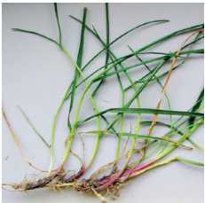
Stolon de Ray-grass anglais traçant