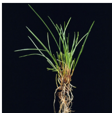
Fétuque rouge traçante