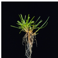
Pâturin des prés