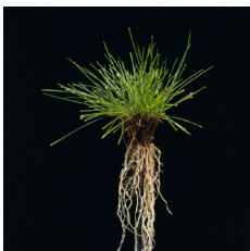
Fétuque rouge gazonnante