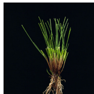
Fétuque rouge ½ traçante