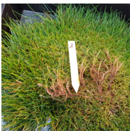
Stolon de Ray-grass anglais traçant