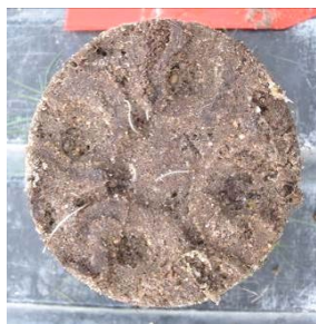
Témoin non traité

Research center, Julius Kühn Institute, Münster 2011