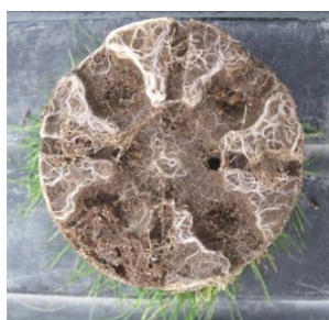
Bacillus R6-CDX ( Vitanica® RZ Bio )